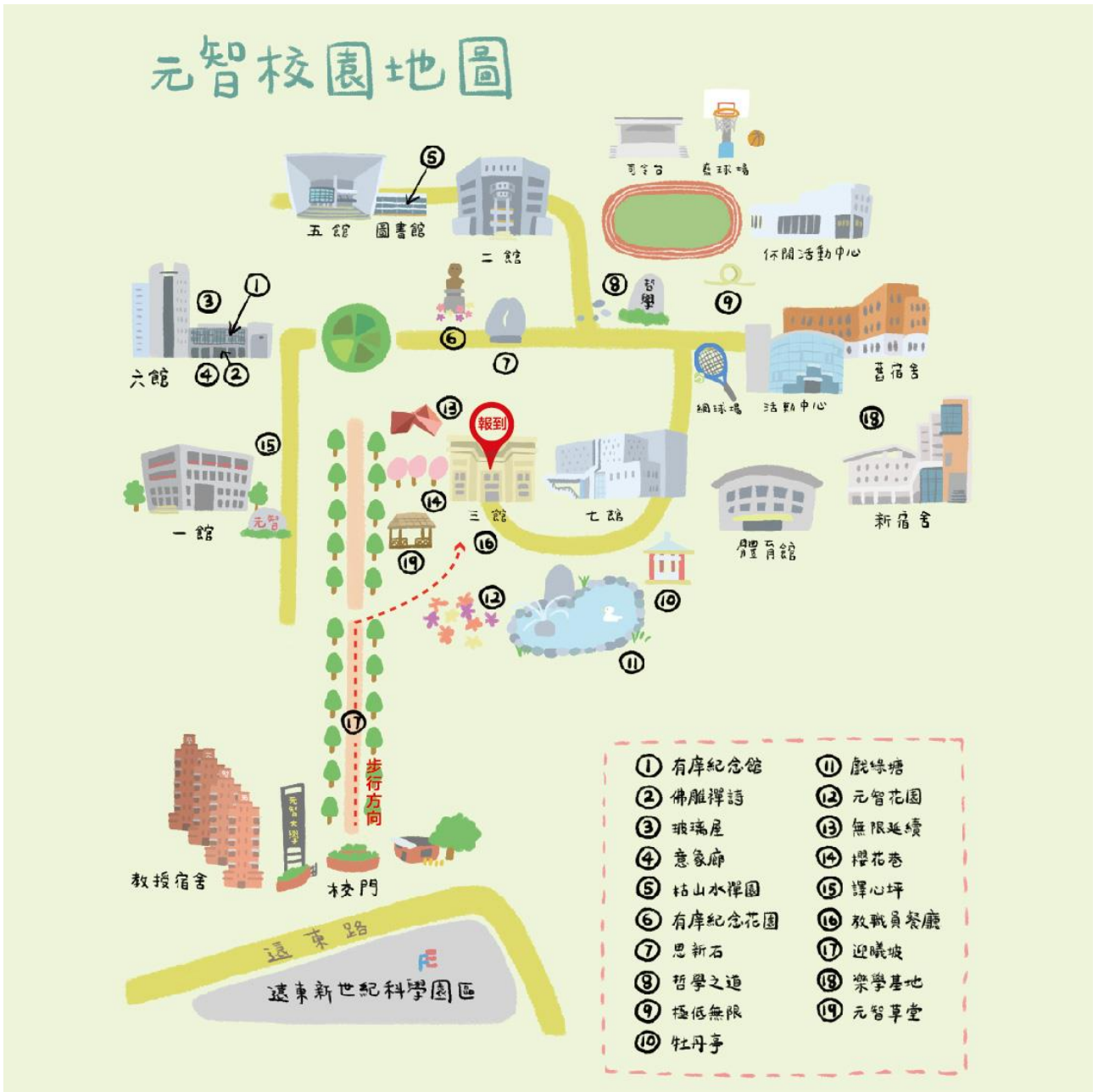
元智大學校區平面圖