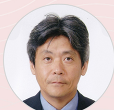
Yoshihiro Okada Kyushu University Library