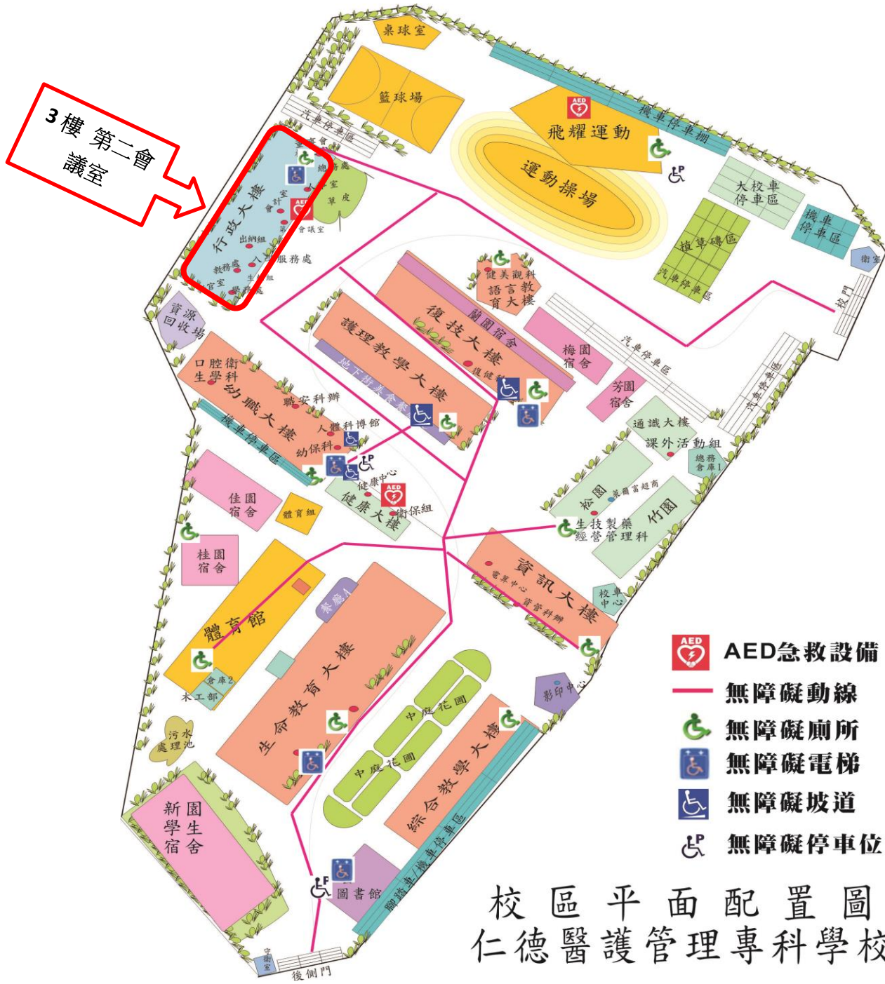
校區平面配置圖 仁德醫護管理專科學校